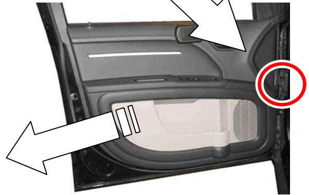
左フロント・ドア