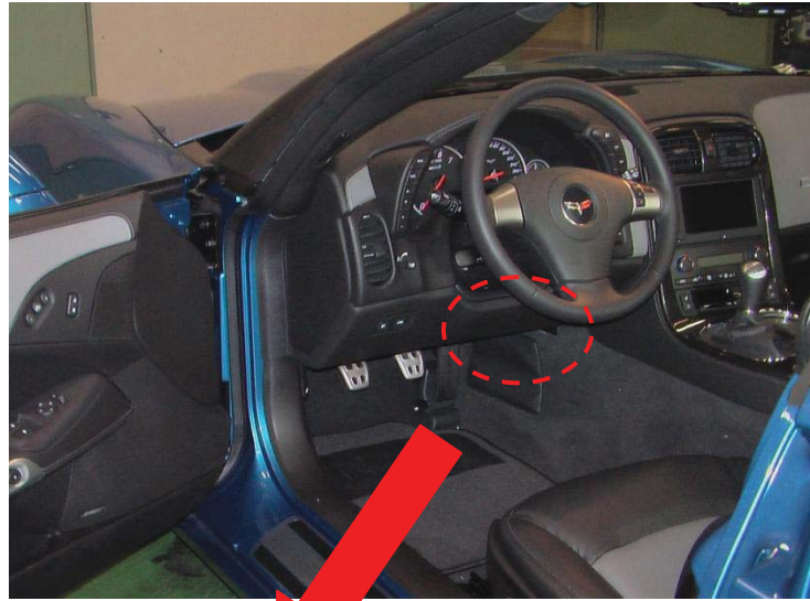
ステアリング角度検出センサー