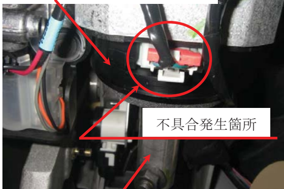
ステアリングシャフト