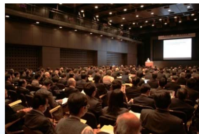
昨年度の会議の様