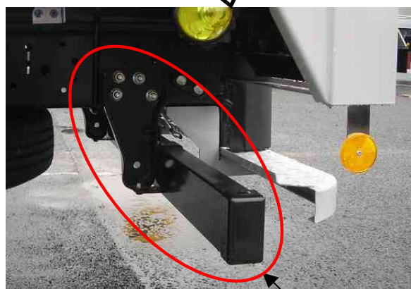
後部突入防止装置