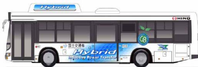
非接触給電ハイブリッドバス外観(イメージ図)